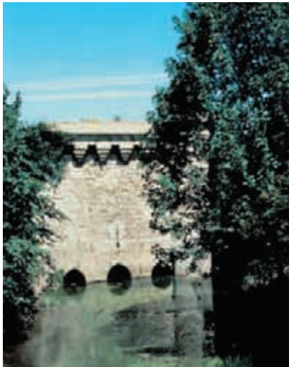
La porte des Arquets est dotée d'un dispositif, encore visible aujourd'hui, permettant aux eaux de l'Escaut d'inonder les fossés.

De rues en places, d'églises en demeures, Cambrai offre au regard les témoins magnifiques ou discrets de son histoire.