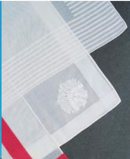
La finesse et la transparence de la toile font la renommée des mouchoirs en batiste de Cambrai.