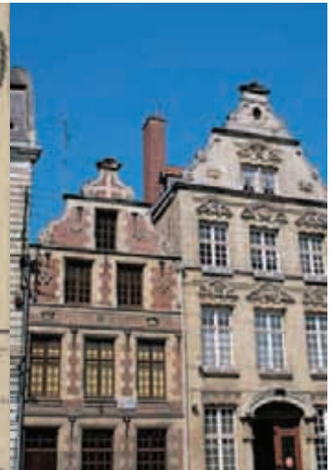
Ces deux maisons du XVII e siècle de la place du Marché présentent les caractéristiques de l'architecture régionale à pignon sur rue à redents ou à volutes.