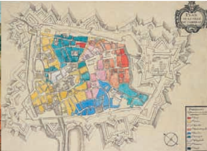
Ce plan de Cambrai du XVIII e siècle montre la répartition des quartiers en neuf paroisses et la ceinture de fortifications et des ouvrages avancés de la ville.