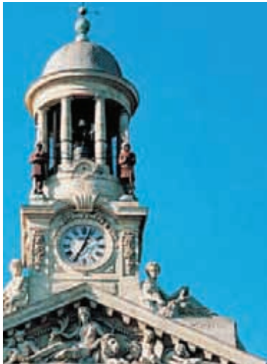
Martin et Martine, les deux jacquemarts de la ville, sonnent les cloches de l'hôtel de ville depuis 1512.