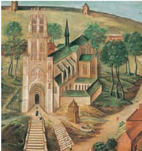
Huile sur toile représentant l'abbaye Saint-Géry au Mont-des-Boeufs avant sa démolition en 1543, d'après Melchior Fallon, maître maçon à Cambrai.

Face aux invasions des IX e et X e siècles, l'évêque Dodilon édifie une enceinte englobant le noyau primitif, la cathédrale et l'abbaye Saint-Aubert. Une autre muraille protège Saint-Géry au Mont-des-Boeufs. Entre ces deux pôles, des quartiers s'organisent. Le marché se développe sur la grande place ; les corps de métiers se regroupent par rues (rues des Rotisseurs, des Chaudronniers...). Au XI e siècle, une enceinte, renforcée au XIV e siècle, contient l'ensemble de la ville et en fige les contours.