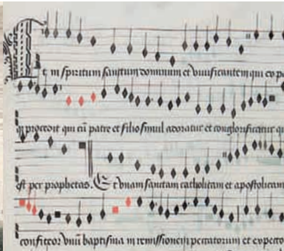
Extrait de messe du XV e siècle composée par Guillaume du Fay, formé à la maîtrise de la cathédrale de Cambrai.