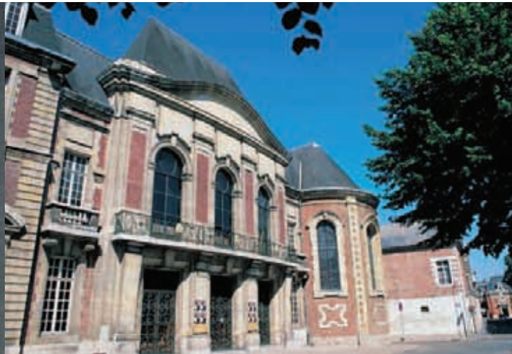
La brique et la pierre sont omniprésentes à Cambrai, comme dans ces deux exemples : la chapelle Saint-Julien du XVIII e siècle et le théâtre de 1924.