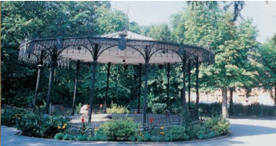
Les kiosques à musique se développent à partir de 1870. Ils sont liés à la démocratisation de la musique et à l'hommage public.