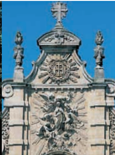
La chapelle des Jésuites, réalisée sur les plans de Jean du Blocq, illustre un courant de l'art baroque introduit par l'archevêque Van der Burch.