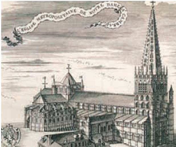
Cette gravure de l'église métropolitaine de Cambrai a été réalisée par Jacobus Harrewyn (1662-après 1732). La "merveille des Pays-Bas" est le fleuron de l'architecture gothique de la région entre 1150 et 1250. Son clocher, achevé au XV e siècle, culmine à 114 m.

En 958, Cambrai connaît un des plus précoces soulèvements communaux d'Europe. En 1077, une nouvelle conjuration, organisée contre l'évêque Gérard II, est violemment réprimée. Plusieurs autres tentatives échoueront jusqu'en 1227, date à laquelle l'évêque Godefroy de Fontaines promulgue une loi instituant la création d'un collège de quatorze échevins et deux prévôts.