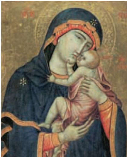
L'icône byzantine Notre-Dame de Grâce, conservée à la cathédrale, fut léguée à la ville en 1451 par le chanoine Fursy de Bruille.